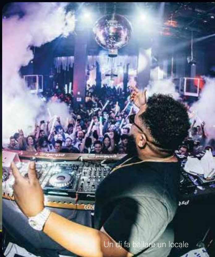
Un dj fa ballare un locale