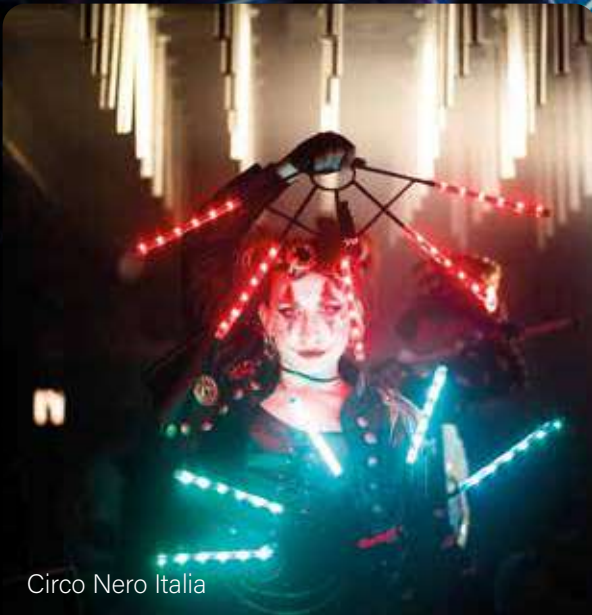
Circo Nero Italia