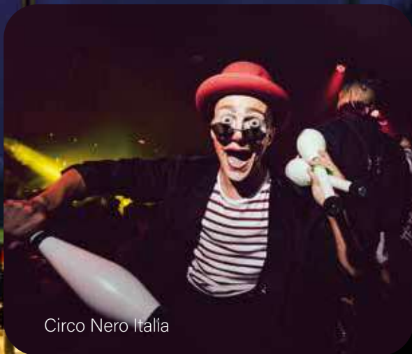
Circo Nero Italia