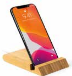
Caricatore wireless in bamboo naturale

I Gadget li abbiamo tutti ma siamo Pazzi per quelli Eco Friendly. Innamorati come siamo della natura e della sua salvaguardia nel nostro Eden i Gadget Ecosostenibili trovano il loro habitat ideale.