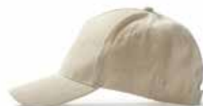
Cappellino 100% organic cotton

CryssaEdenPlus= + Servizi per le aziende di ogni dimensione