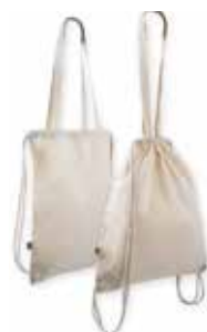
Sacca/Shopper 2 in 1 cotone fairtrade