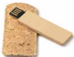
Pen drive in cartoncino riciclato con custodia in sughero