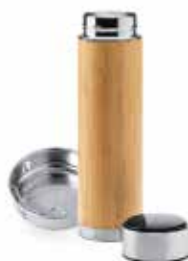
Thermos in bamboo con infusore