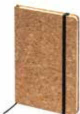
Notes copertina rigida in sughero