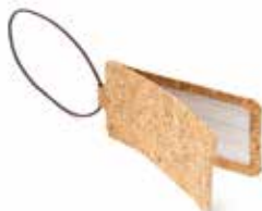
Etichetta bagaglio in sughero