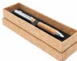
Penna roller in bamboo