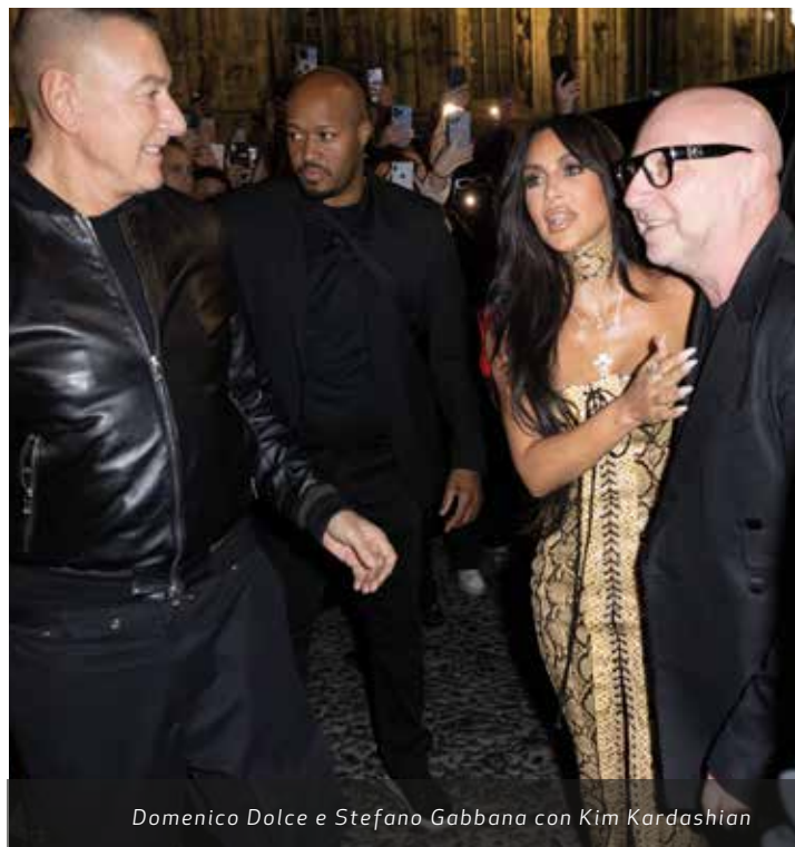
Domenico Dolce e Stefano Gabbana con Kim Kardashian

i 20 e i 27 che hanno già frequentato una scuola di moda. Iniziare questo percorso vuol dire avere la possibilità di salvaguardare un'arte antica, difendendo il patrimonio italiano del fatto a mano. Non finisce qui: tra i nuovi progetti c'è il debutto nel settore immobiliare, con due progetti residenziali in Usa e Spagna e uno di hospitality alle Maldive. Sono ambasciatori del Made in Italy anche in questo settore, per un lifestyle a 360 gradi.