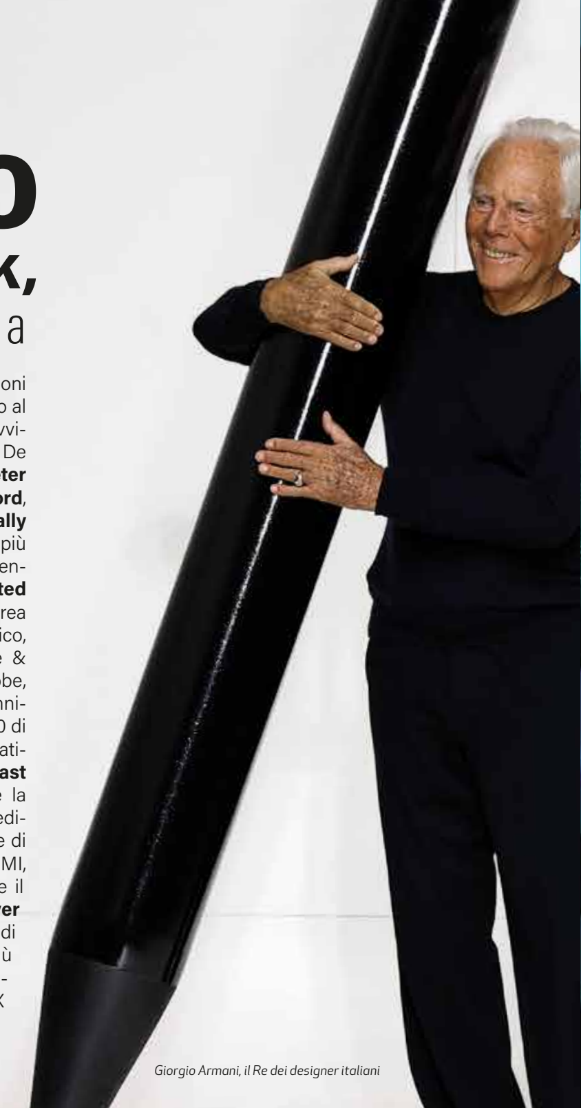
Giorgio Armani, il Re dei designer italiani