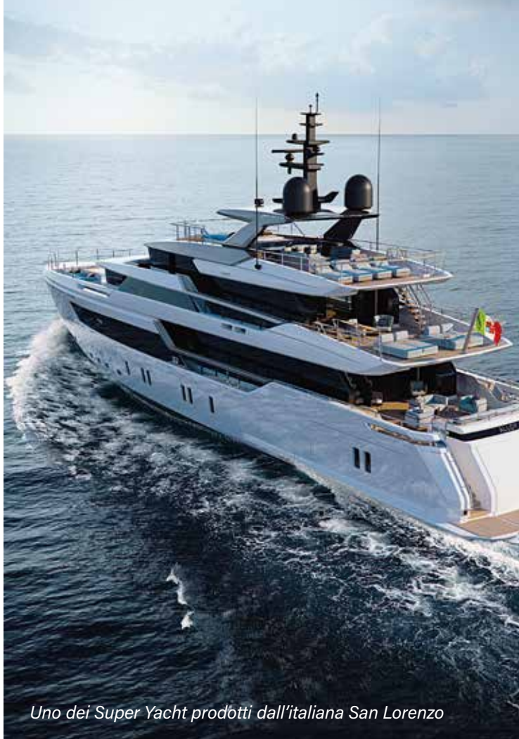
Uno dei Super Yacht prodotti dall'italiana San Lorenzo

alle crociere nei porti della penisola, con un trend in crescita incredibile: +37,6% rispetto al 2022 e +9,2% rispetto al 2019. E i super yacht? Per le imbarcazioni a motore oltre i 30 metri il nostro paese è incontrastato leader mondiale: un natante su due di questo tipo è Made in Italy. Nel 2021 la produzione valeva ben 3,6 miliardi di euro, con un incremento del 34% rispetto al 2020. Anche in questo caso l'export la fa da padrone, con l'88% della produzione. La tendenza continua: nel 2022, secondo The Superyacht Group, sono stati consegnati ben 174 super yacht in più rispetto all'anno precedente. E che dire degli hotel ? I 668 cinque stelle italiani mettono a disposizione 44.768 stanze, appena il 4% del settore, che però genera il 30% dei circa 22 miliardi fatturati dal settore. Perché lusso significa eccellenza, qualità ed alto valore aggiunto. Il lusso italiano vive di professionisti che lavorano dietro le quinte, in ogni settore. Tra i più affermati in ambito musica e dintorni, ecco Matteo Arancio e Roberto Brignoli. Rubrasonic , la loro agenzia, si occupa da oltre vent'anni di strategie sonore e musicali su misura per spazi e brand. Tra i loro clienti, marchi deluxe come Lefay Resorts, Castelfalfi, Adler, Pjaio e Nove 25 e grandi catene come Kiko Milano. "Il lusso è un'esperienza, il prodotto o il servizio che va oltre le necessità di base, offrendo piacere, esclusività e raffinatezza" , spiegano. "E' fatto di alta qualità, design e materiali